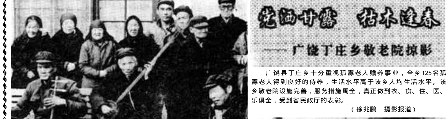
冬天里，晒着太阳，唱唱书，对老人们来说是再好不过了。

河口讯 近年来，河口区在发展党员工作中，把发展重点放在农业生产一线上。去年以来，全区发展一线农民党员94名，占发展党员总数的75%，其中，35岁以下的青年农民44名，占农民党员总数的46.8%，为农村基层党组织补充了新鲜血液，增添了生机与活力。 为提高新党员素质，促其尽快成长，河口区采取切实措施，加强